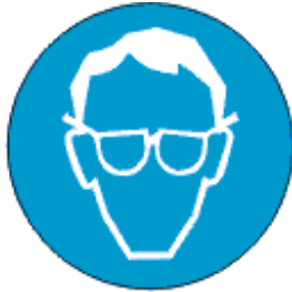
Kanna silmakaitse- vahendit

Kohustumärgi olulised tunnused on ümar kuju, valge piltkiri sinisel taustal, kusjuures sinine osa moodustab vähemalt 50% märgi pindalast.