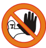
Kõrvalise isiku sisenemise keeld