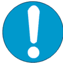
Üldine kohustumärk (vajadusel kasutatakse koos mõne teise märgiga)