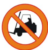
Veoki sissesõidu keeld