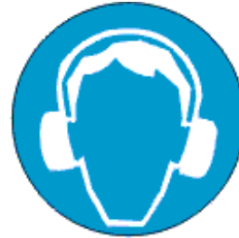
Kanna kuulmis- kaitsevahendit