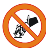
Veega kustutamise keeld