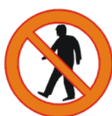
Jalakäija sisenemise keeld