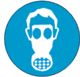
Kanna hingamisteede kaitsevahendit