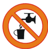
Joogiks kõlbmatu vesi