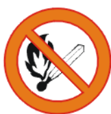
Suitsetamise ja lahtise tule kasutamise keeld